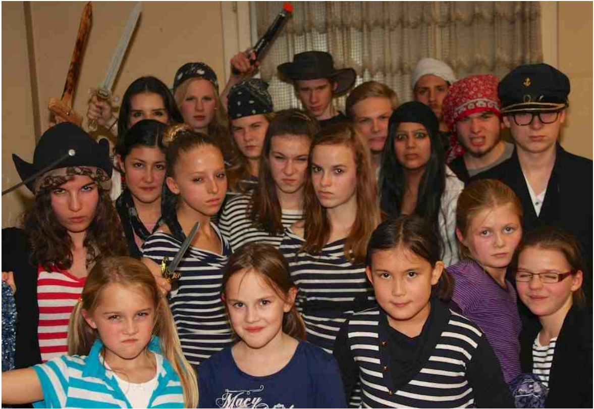
Mitwirkende Schatzinsle, 2013